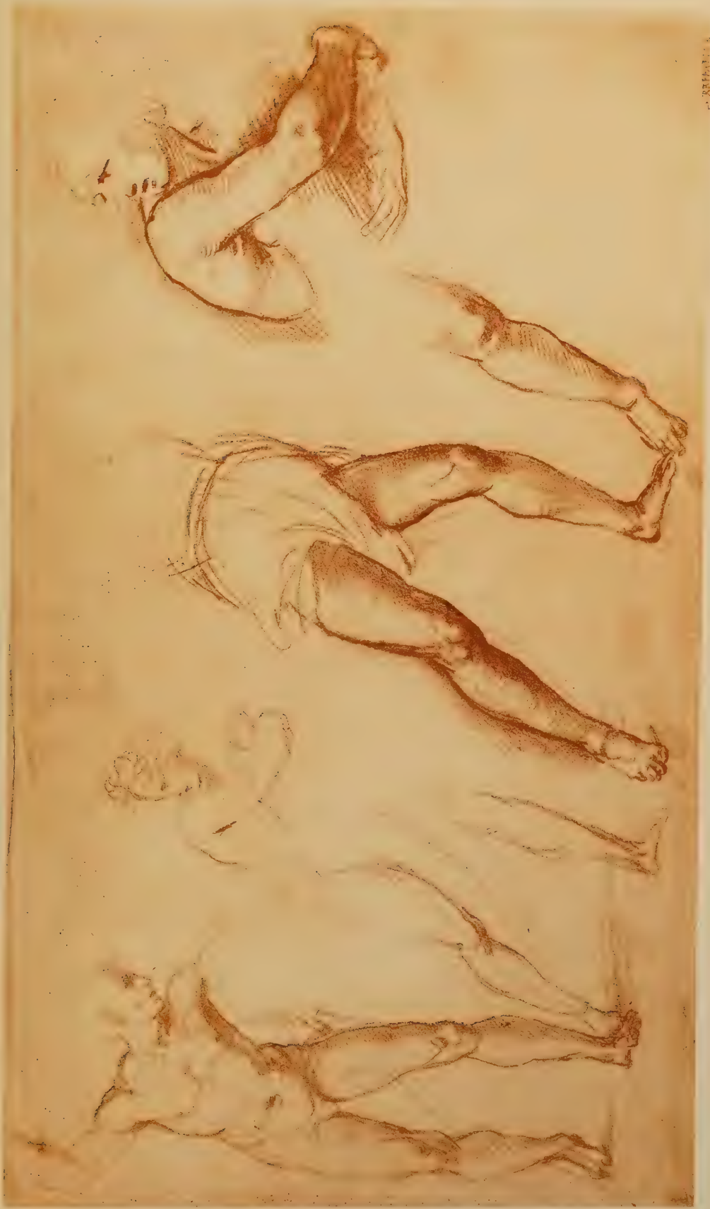
Dessin pour le Massacre des Innocents